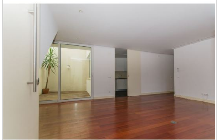
Wohnzimmer mit Atrium