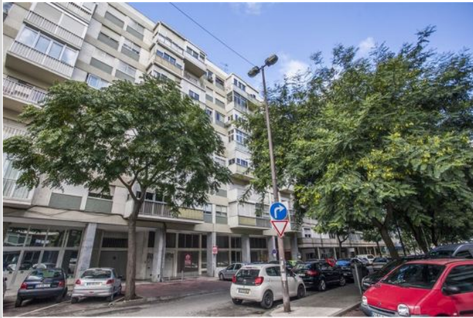
Außenansicht des Hauses

Zimmer: 3,00 Wohnfläche ca.: 78,00 m 2 Kaufpreis: 160.000,00 EUR