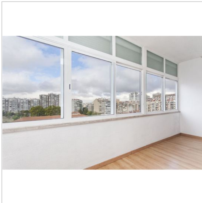
Fernblick über Protugal